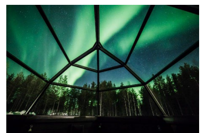
住宿觀賞極光度假小屋

安排專車前往無光害的空曠地方尋找北極光，並於知名極光聖地—拉普蘭地區住宿6晚，盡情享受雪地極光風情。