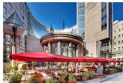
入住 5 星級豪華住宿

碧湖為斯洛文尼亞著名的景點，又有「藍湖」之稱。乘船觀賞碧湖青山綠水，並到訪坐立湖中的碧湖古堡，把碧湖的美景盡收眼底。