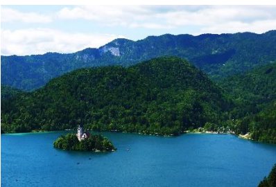
遊覽斯洛文尼亞碧湖

由於昔日國皇於皇宮原址發現一口清泉，所以又稱「美泉宮」。皇宮內裝潢華美，精緻的傢具，以及天花頂的壁畫和浮雕裝飾富麗堂皇。遊覽據說是以凡爾賽宮為設計藍本的遜御花園。