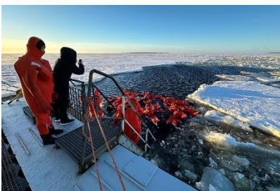
極地探索號 Polar Explorer 之旅

安排乘坐「極地探索號 Polar Explorer」在浮冰上巡遊，以及穿上特製浮衣體驗漂浮於冰海的感覺。