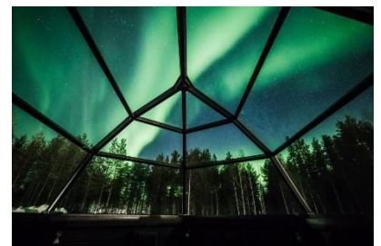
住宿觀賞極光度假小屋

安排專車前往無光害的空曠地方尋找北極光，並於知名極光聖地—拉普蘭地區住宿 6 晚，盡情享受雪地極光風情。