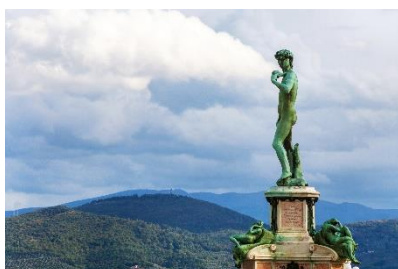
意大利米高安哲奴廣場

白露里治奧古城是建於 2,500 年前，位於山頂端的小城，只靠一條狹窄的長橋與外界相連，從遠處看像一座空中的城堡，因此被稱為「天空之城」。