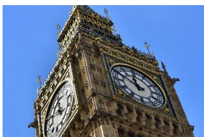
英國大笨鐘與白金漢宮

嘆息橋的名字是 19 世紀時，由英國詩人、「風騷的浪漫主義文學泰斗」拜倫勳爵所取的。嘆息橋有如隔絕生死兩世，所以從橋上走過時，望出最後一眼美麗的威尼斯，不禁一聲長嘆。